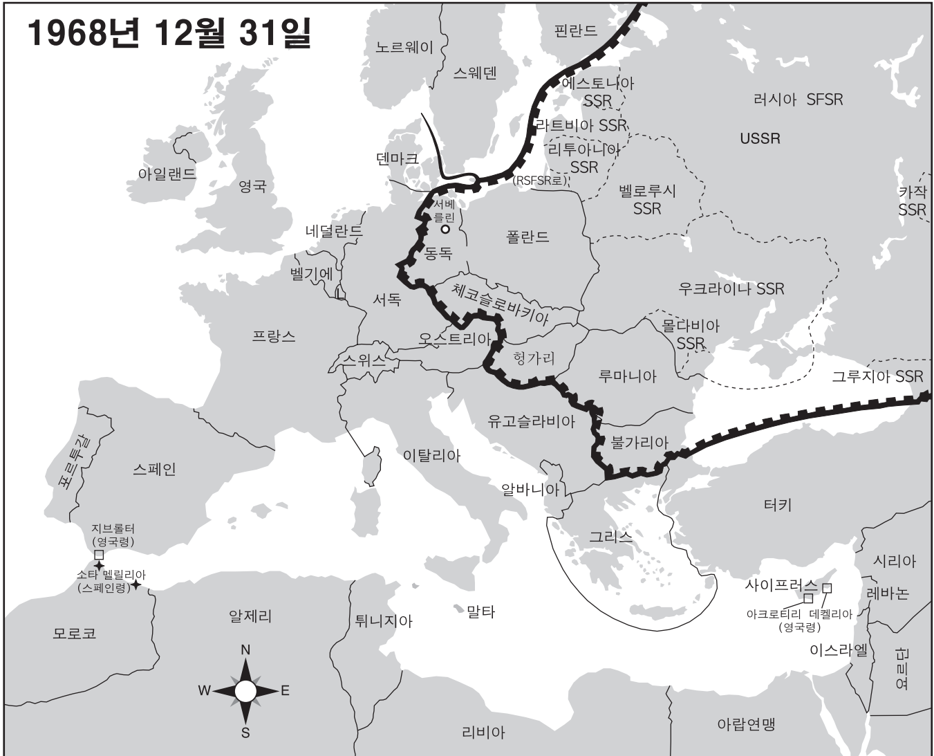
출처: Colin McEvedy, The New Penguin Atlas of Recent History: Europe Since 1815 , Penguin Books (개정판)

36번 문제와 37번 문제는 아래의 지도와 사회학 지식을 바탕으로 답하시오.