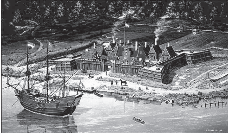
來源: Painted by L. F. Tantillo, "Fort Orange," www.lftantillo.com

一些殖民聚點靠近早期的堡壘,這些地方位於河流和湖泊旁邊。因為只有很少的路供殖民者們使用,水上運輸使旅行更為容易。河流和湖泊也是食物和淡水的極好來源。