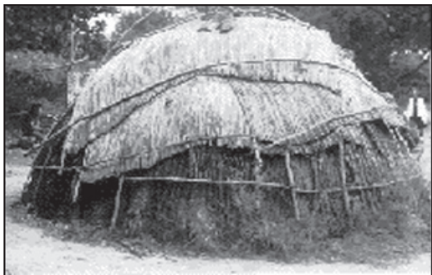
美洲原住民的棚屋