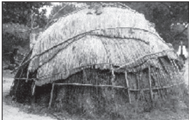
Kay an fòm won Endyen