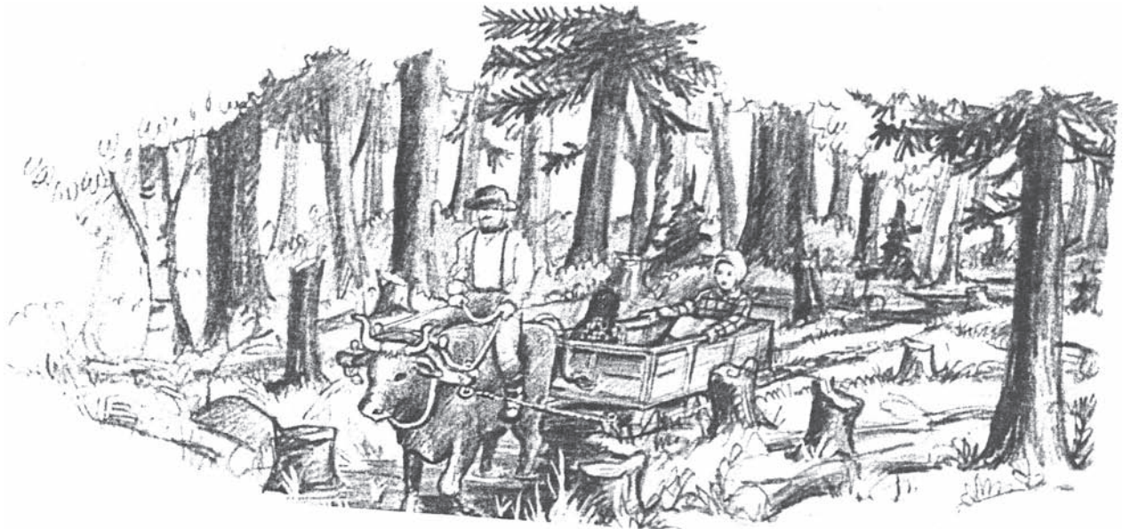
Sous: Barbara Greenwood, A Pioneer Sampler , Houghton Mifflin

Vwayaje sou tè te di anpil pou premye imigran yo. Majorite wout ki te la yo te soti [te fèt] nan ansyen ti wout endyen yo ki te travèse fwontyè ansyen New York la. Pou trase wout la, premye travay la te toujou pi difisil. Yo te bezwen retire branch bwa, gwo wòch, ti pye bwa, ak gwo pye bwa. Nòmalman, travay sa a te fèt ak men oubyen yo te itilize cheval. Lè yo fin retire tout debri, yo kòmanse glasiye. Sa a te yon siy ki montre gen yon wout ki fèt, ki montre yon diferans ant yon santye pou pyeton oswa pou bèt.