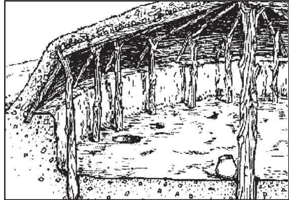
Wigwam de Indígenas norteamericanos Cobertizo de indígenas norteamericanos

Al principio, los colonos tenían que acomodarse en refugios temporales. Los wigwams ingleses eran estructuras en forma de domos que habían copiado de las casas de los indios algoquianos. Estas casas consistían de un cuarto con piso de tierra y una entrada muy baja. Los colonos holandeses generalmente construían cobertizos, que consistían en huecos cavados a los lados de las colinas o en el suelo. Eventualmente, todas estas casas temporales fueron reemplazadas por casas más permanentes.