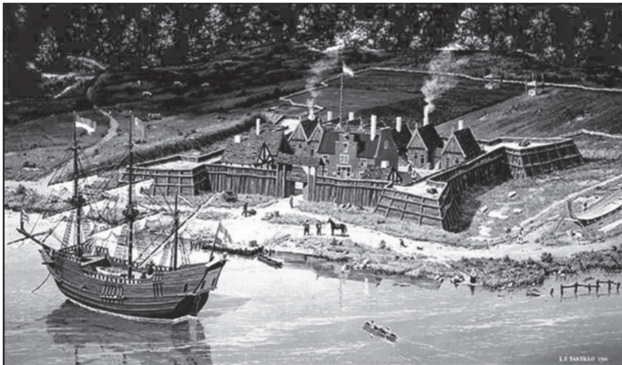
Fuente: Painted by L.F. Tantillo, "Fort Orange," www.lftantillo.com

Algunos poblados comenzaron cerca de los primeros fuertes, los cuales estaban localizados cerca de ríos o lagos. Existían pocos caminos para el uso de los colonos, así que el transporte por el agua hacía más fáciles los viajes. Los ríos y lagos eran también una excelente fuente de alimentos y agua dulce.