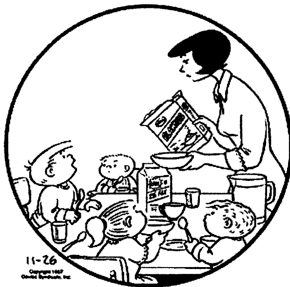
— Bil Keane, “The Family Circus” (adapted)

33 In Spanish, write a story about the situation shown in the picture below. It must be a story relating to the picture, not a description of the picture. Do not write a dialogue.