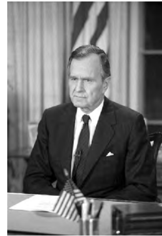
老布希總統 (George H. W. Bush)