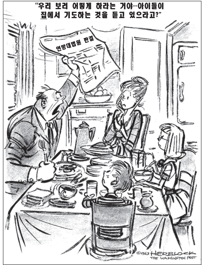
출처: Herblock, The Washington Post , June 18, 1963