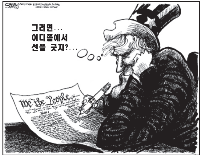
출처: Scott Stantis, The Birmingham News , June 27, 2002 (개정판)