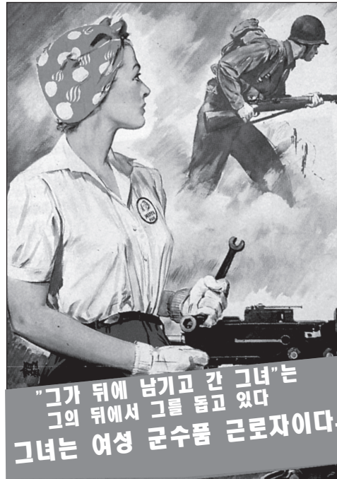
출처: U.S. Army, Adolph Treidler, artist, 1943