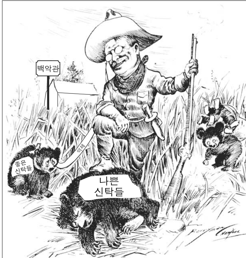
출처: Clifford K. Berryman, Washington Evening Star , October 11, 1907 (개정판)

7b 이 만화가에 따르면, 신탁에 대한 테오도어 루즈벨트 대통령의 정책은 무엇이었는가? [1]