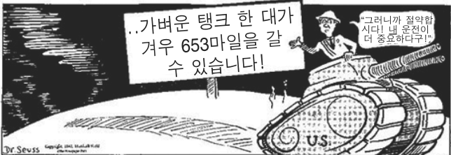
출처: Dr. Seuss, PM, April 7, 1942

34 이 제2차 세계대전 만화는 미국인들에게 무엇을 장려하기 위해 사용되었는가?