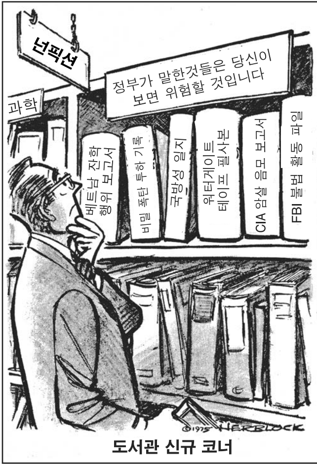
출처: Herblock, Washington Post, December 4, 1975

41 번 문제는 아래의 만화와 당신의 사회학 지식을 바탕으로 답하십시오.