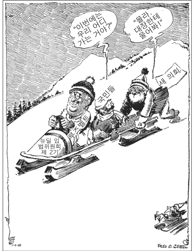
출처: Fred O. Seibel, Richmond Times Dispatch , January 4, 1936 (개정판)

32 프랭클린 D. 루즈벨트 대통령의 제2차 임기 계획에 대한 진술 중 위 만화의 주된 아이디어를 가장 정확하게 표현하는 것은?