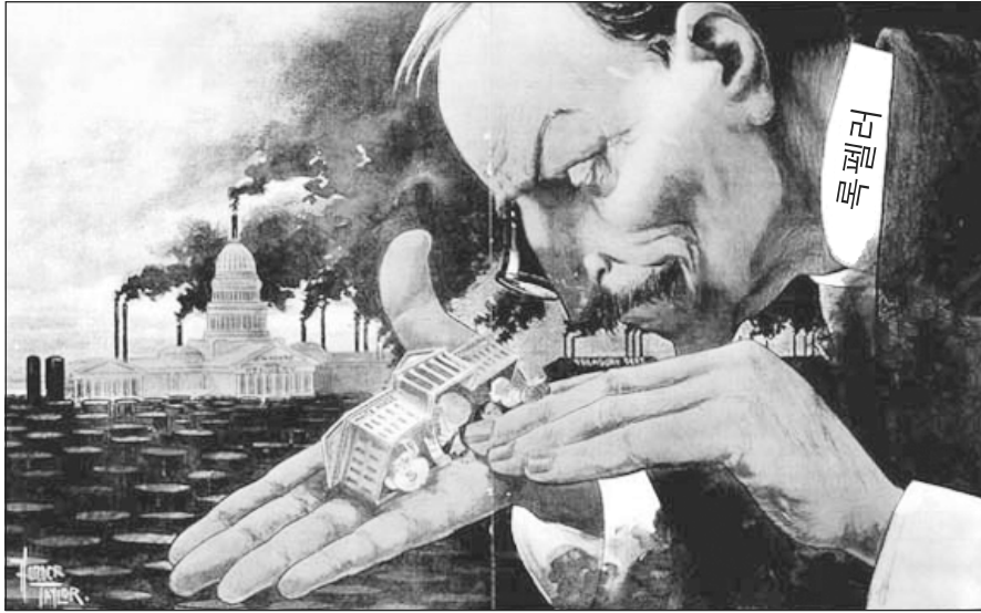
출처: Horace Taylor, The Verdict , January 22, 1900 (개정판)

7a 정부와 존 D. 록펠러와 같은 기업가들 간의 관계에 대한 이 만화가의 관점은 무엇인가? [1]