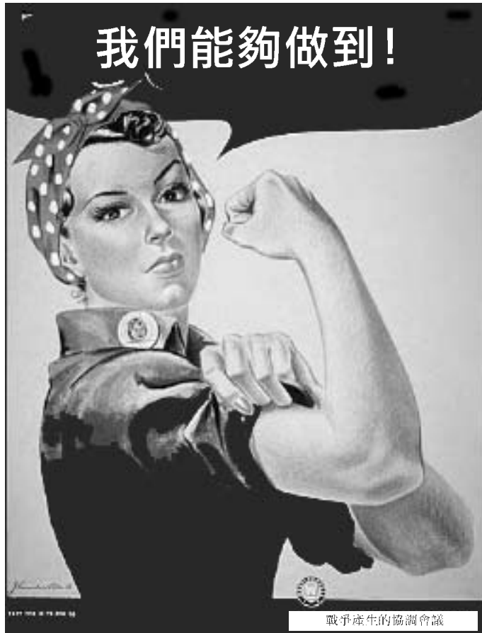
資料來源：J. Howard Miller，鉚釘工人露茜(Rosie the Riveter)的「我們能夠做到！」("We Can Do It!") (經改編)