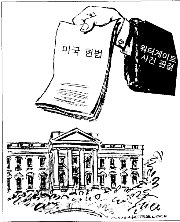
출처: Herb Block, America, the Glorious Republic, Houghton Mifflin Co.