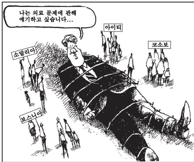
출처: Chip Bok, Creators Syndicate (발체)

문제 45는 아래의 만화와 사회 과목에 관한 지식을 바탕으로 답하십시오.