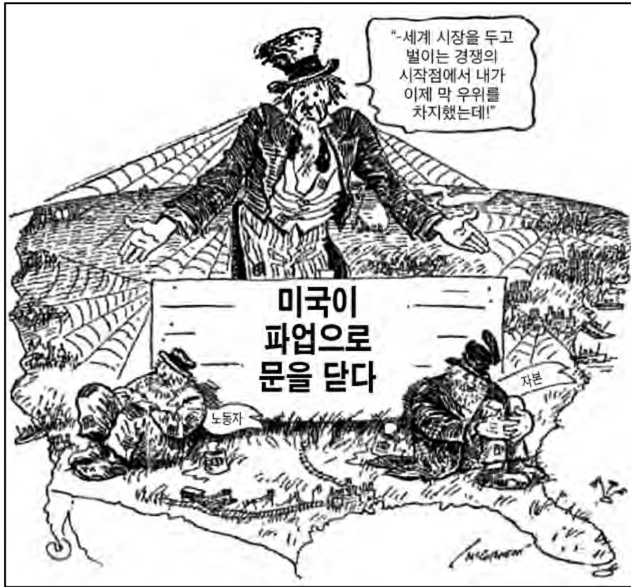
출처: John McCutcheon, Chicago Tribune , 1919 (개정판)

24 다음 중 이 1919년 삽화가 주장하는 점을 가장 정확하게 묘사하는 것은?