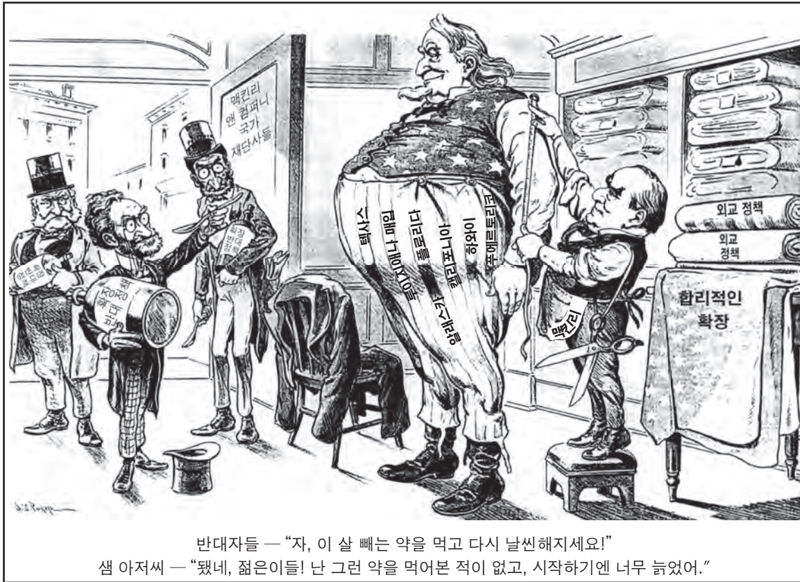
출처: J. S. Pughe, Puck , September 5, 1900 (개정판)