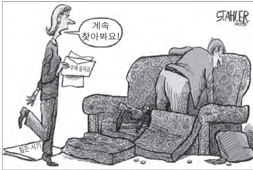
출처: Jeff Stahler, Columbus Dispatch, March 7, 2009 (개정판)

45번 문제는 아래의 삽화와 자신의 사회과학 지식을 바탕으로 답하십시오.