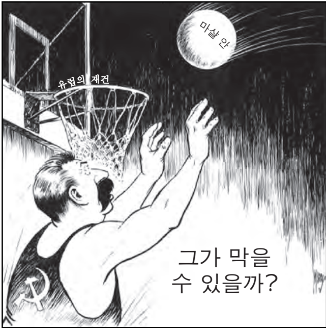
출처: Edwin Marcus, c. 1947, Library of Congress (개정판)

36번 문제는 아래의 삽화와 자신의 사회과학 지식을 바탕으로 답하십시오.