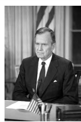
조지 H. W. 부시 대통령