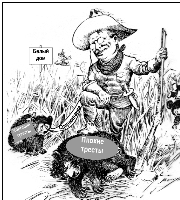
Источник: Triumph of the American Nation [Триумф Америки как страны], Harcourt Brace [Харкур Брейс]

В ответе на вопрос 26 исходите из помещенной ниже карикатуры и своих знаний по общественным наукам.