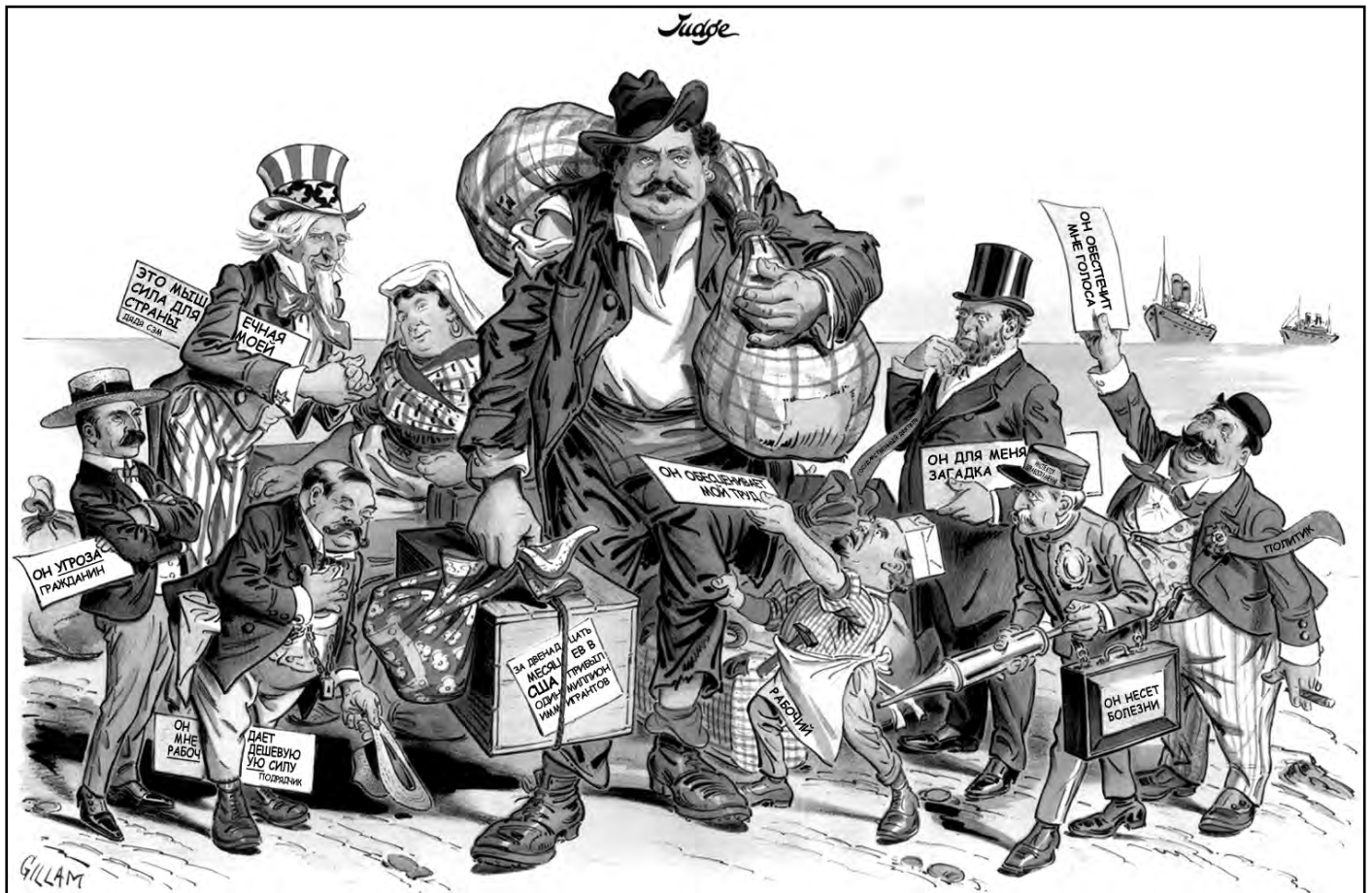
Источник: Victor Gillam, Judge , September 19, 1903 (адаптировано)

25 Какое утверждение наиболее точно отражает точку зрения, выраженную этой карикатурой 1903 года?