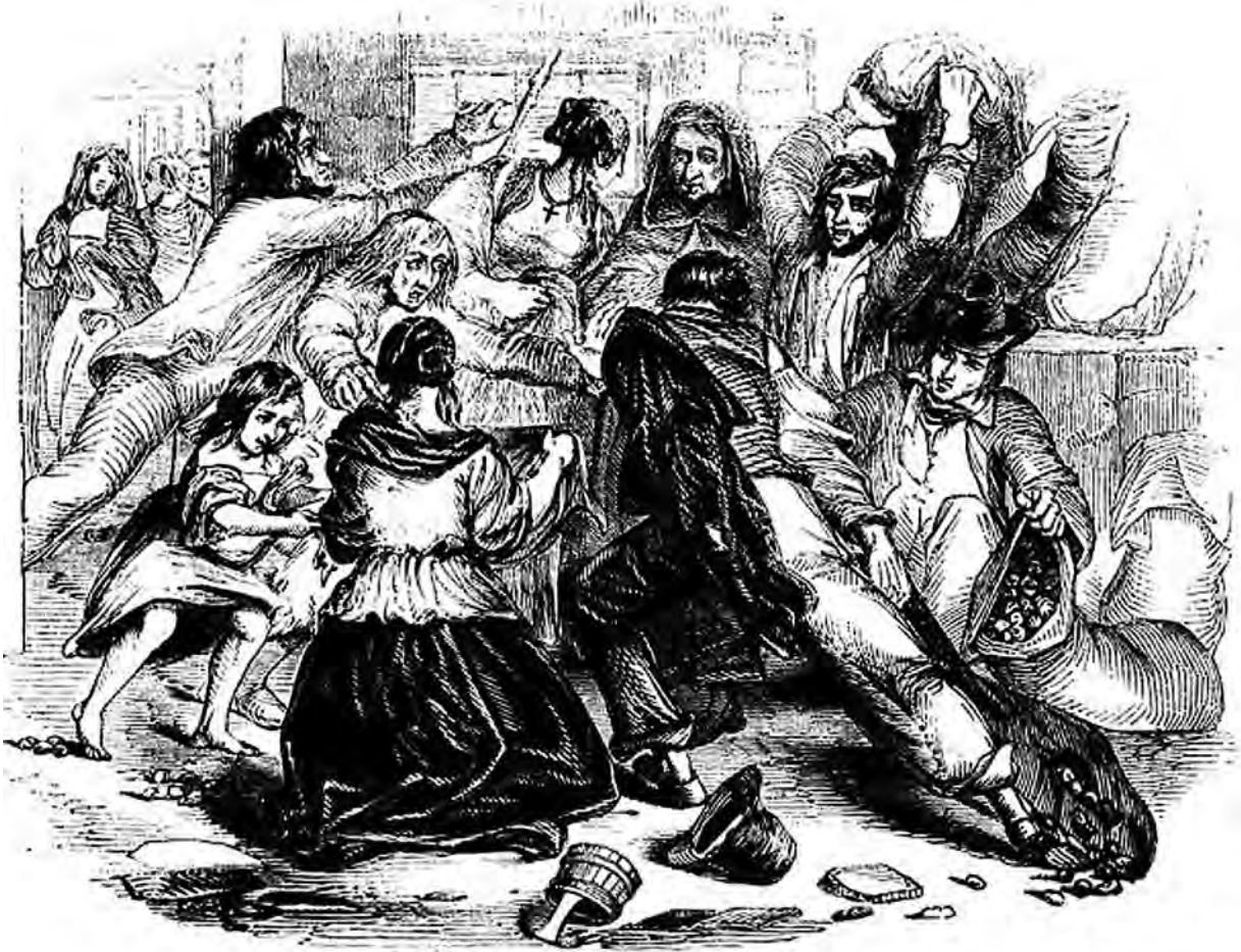
هجوم على متجر بطاطا.

وقعت أعمال الشغب بسبب المجاعة في غالواي قبل سنوات قليلة من تلف محصول البطاطا. بدأت مجاعة البطاطا الأيرلندية في عام 1845.