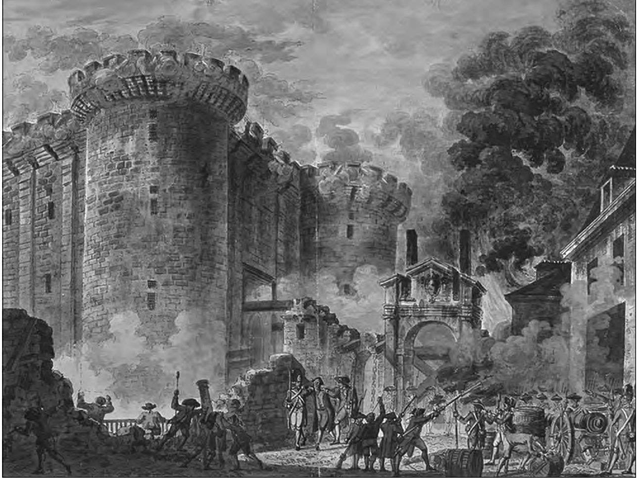
Jean-Pierre Houël, The Storming of The Bastille , July 14, 1789

يعتبر الكثيرون الهجوم على سجن الباستيل في باريس أول حدث عنيف كبير للثورة الفرنسية.