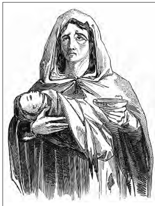
Sous: James Mahony, “Sketches in the West of Ireland,” The Illustrated London News , February 13, 1847 (adapte)

. . . “Mwen te kòmanse nan Cork, nan kourye a [antrenè] (enfòmètè nou an di), pou Skibbereen epi mwen te wè yon tikras jiskake nou te vini nan Clonakilty, kote charyo a te kanpe pou dejene; epi isi a, pou premyè fwa, atwosite povrete yo te vini vizib, nan kantite vas pòv grangou yo, ki te antoure charyo a pou mande la charite: pami yo yon fanm ki t ap pote nan bra li kadav yon bèl timoun, epi li t ap fè apèl ki pi aflijan ak pasaje yo pou èd pou ede li achte yon sèkèy pou antere ti bebe cheri li a. Espèktak orib sa a te pèsyade mwen pou fè kèk ankèt sou li, lè m te aprann nan men moun otèl la chak jou te mennen plizyè douzèn kandida konsa nan vil la. . . .”