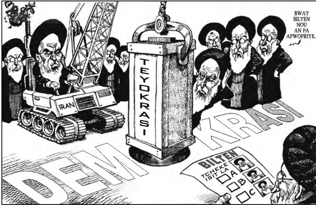
Sous: Kevin Kallaugher, The Economist , February 14, 2004 (adapte)

Sèvi ak desen ki anba la ak sa ou konnen nan syans sosyal pou reponn kesyon 18 ak 19.