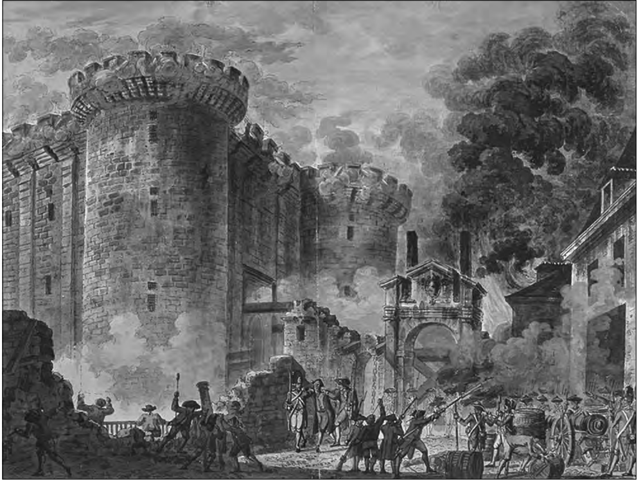
Fuente: Jean-Pierre Houël, The Storming of The Bastille , July 14, 1789, World History Encyclopedia

Muchos consideran que el ataque a la prisión de la Bastilla en París fue el primer evento importante y violento de la Revolución Francesa.