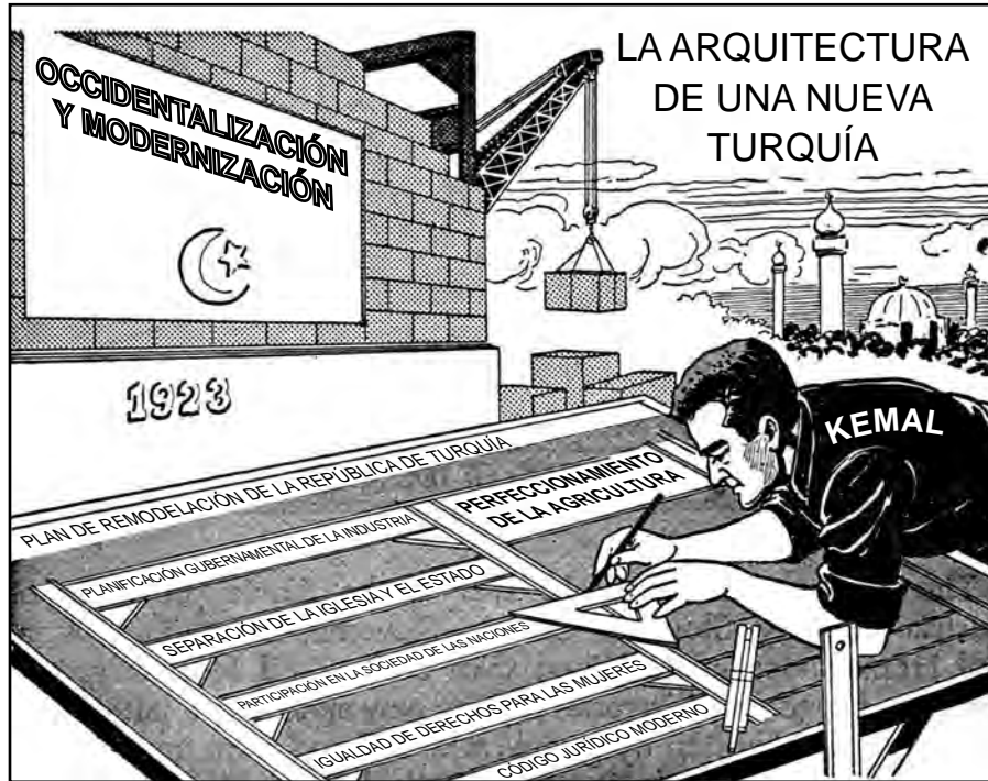
Fuente: Philip Dorf, Historia mundial visualizada (Visualized World History), Oxford Book Company, 1958

Base sus respuestas a las preguntas 18 y 19 en la siguiente ilustración y en sus conocimientos de estudios sociales.