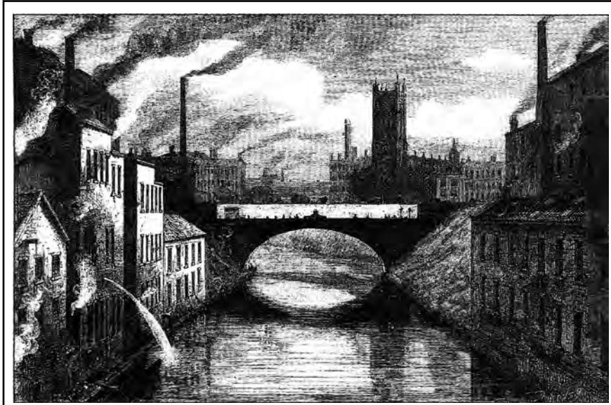
블랙프라이어스 다리는 영국의 맨체스터의 어웰 강 위에 있습니다.