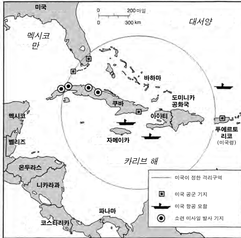
출처: World History on File, Second Edition, The 20th Century, Facts On File (개정판)

9a 이 지도에 있는 정보에 근거하여, 쿠바가 소련의 동맹국이 됨으로 인해 냉전이 쿠바에 미친 영향 한 가지 를 쓰십시오. [1]