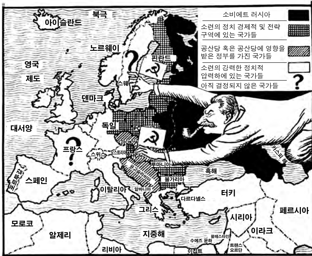
출처: Leslie Illingworth, Daily Mail , June 16, 1947 (개정판)