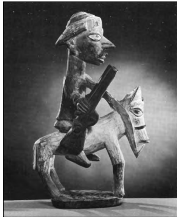
Fuente: Leon E. Clark, ed., Through African Eyes , Praeger (adaptado)