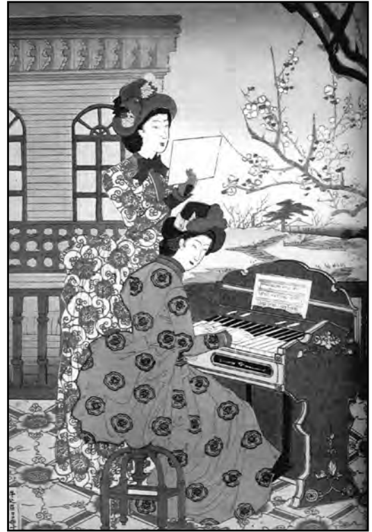
Imagen de canciones entre flores del ciruelo

Fuente: Hashimoto Chikanobu, December 1887 (adaptado)