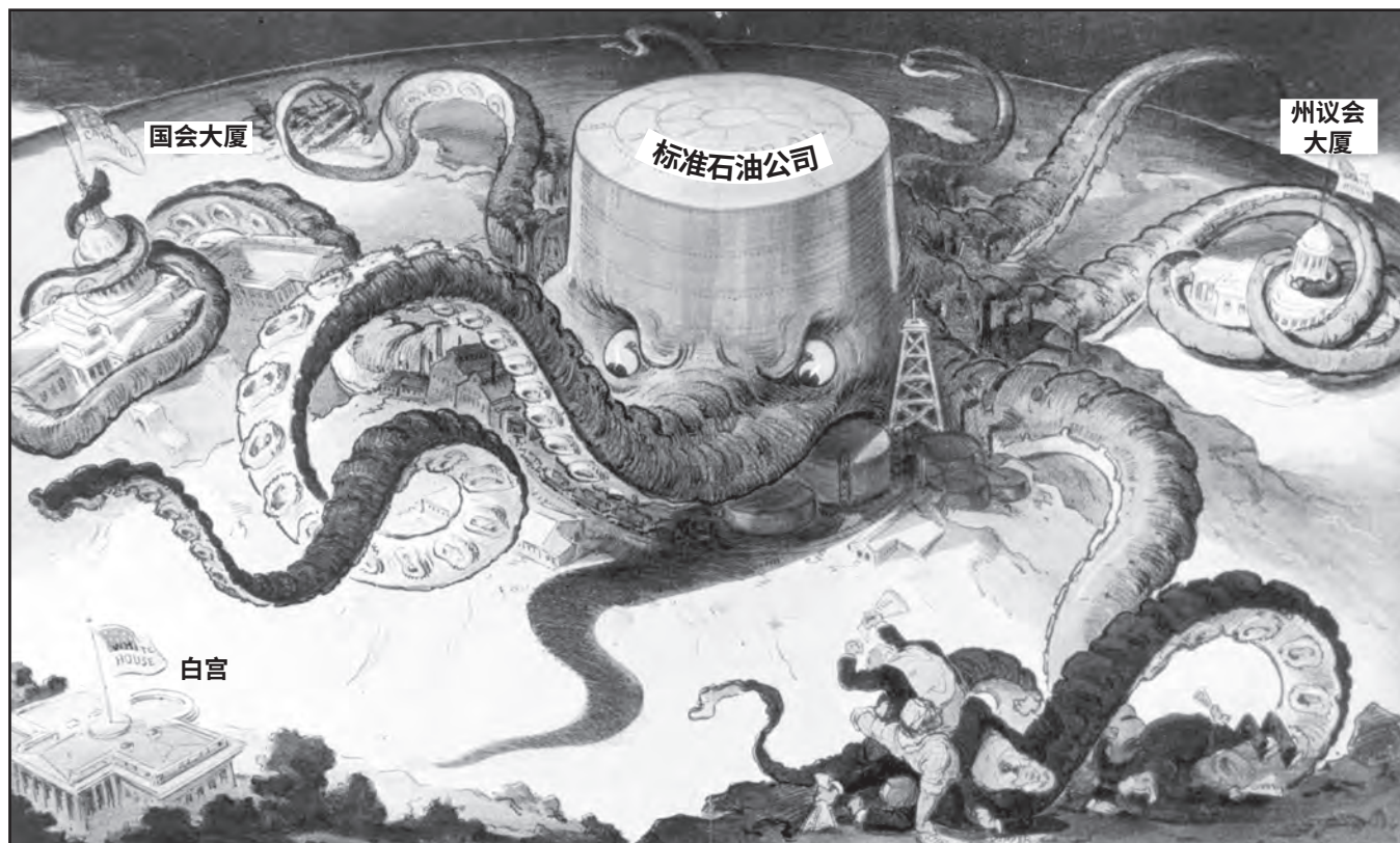
来源: Udo J. Keppler, Puck, September 7, 1904 (经改编)