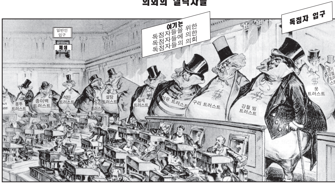
출처: Joseph J. Keppler, Puck , 1889 (개정판)

3a 조셉 J. 케플러의 만화는 어떤 한 정치적 문제를 취급하고 있는가? [1]