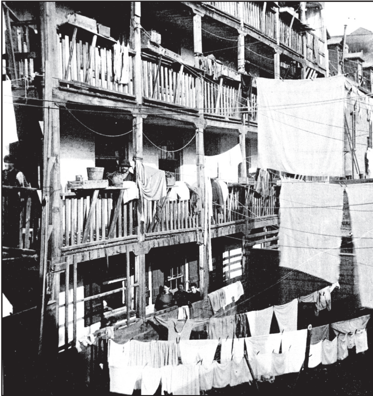
출처: Jacob Riis, 1890