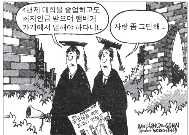
출처: Walt Handelsman, Newsday, 2003 (개정판)