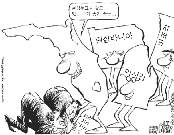
출처: Jeff Parker, Florida Today, 2000 (개정판)