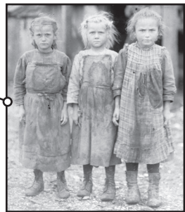
출처: Library of Congress (개정판)

8 아래 포스터의 정보에 의하면 아동노동은 왜 국가적 문제로 여겨지나? [1]