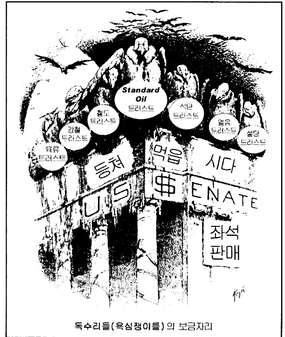
자료: Graff, Henry, The Glorious Republic , Houghton Mifflin (각색됨)