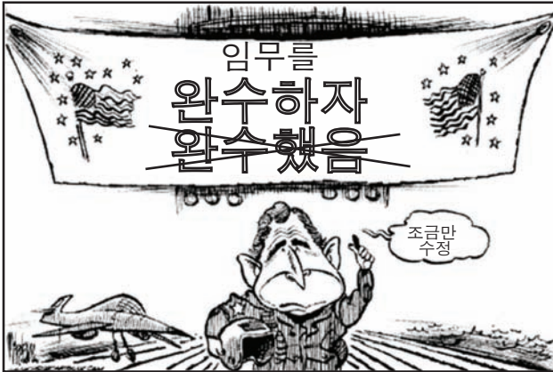
출처: Mike Lane, Baltimore Sun, June 30, 2005

43번 문제는 아래의 삽화와 본인의 사회과학 지식을 바탕으로 답하십시오.