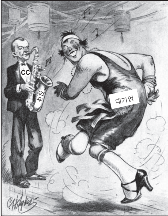
출처: Andrew Cayton et al., America: Pathways to the Present , Prentice Hall, 1995 (개정판)