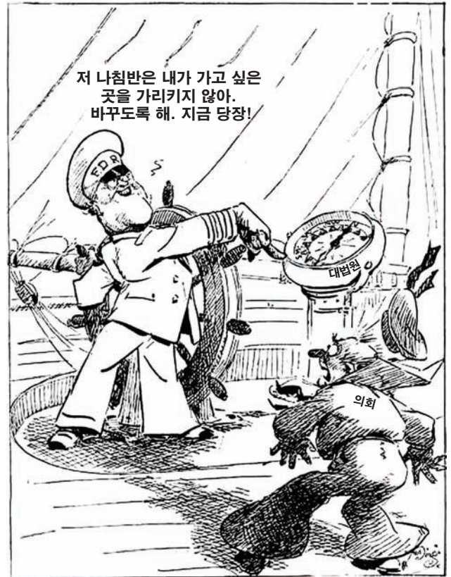
출처: J. N. "Ding" Darling, Des Moines Register March 29, 1937 (개정판)