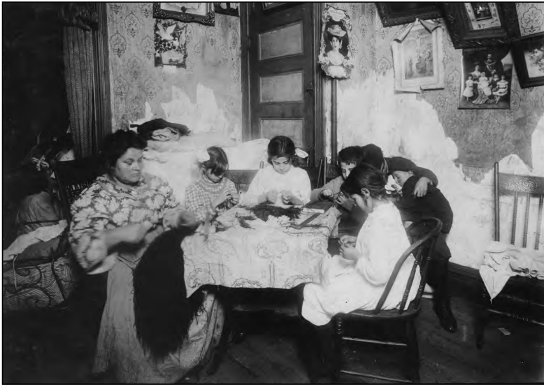
출처: Lewis Wickes Hine, December 1911, Library of Congress

2 이 사진들을 볼 때, 공동 주택에 사는 가족들이 직면했던 한 가지 상태는 무엇이었습니까? [1]