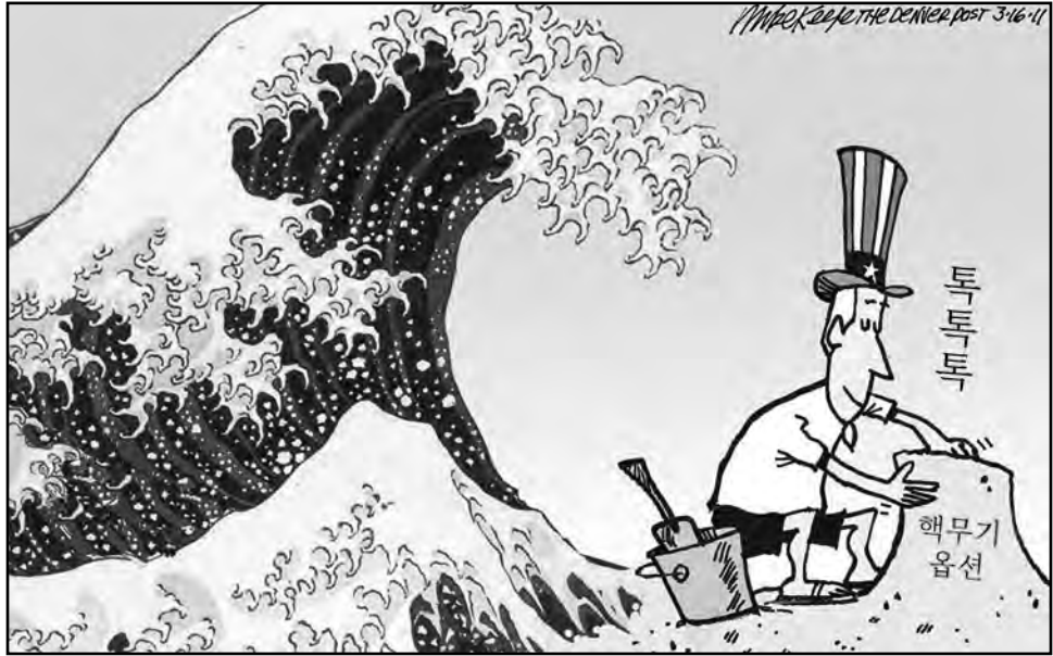
출처: Mike Keefe, Denver Post , March 16, 2011

48번 문제는 아래의 삽화와 자신의 사회과학 지식을 바탕으로 답하십시오.