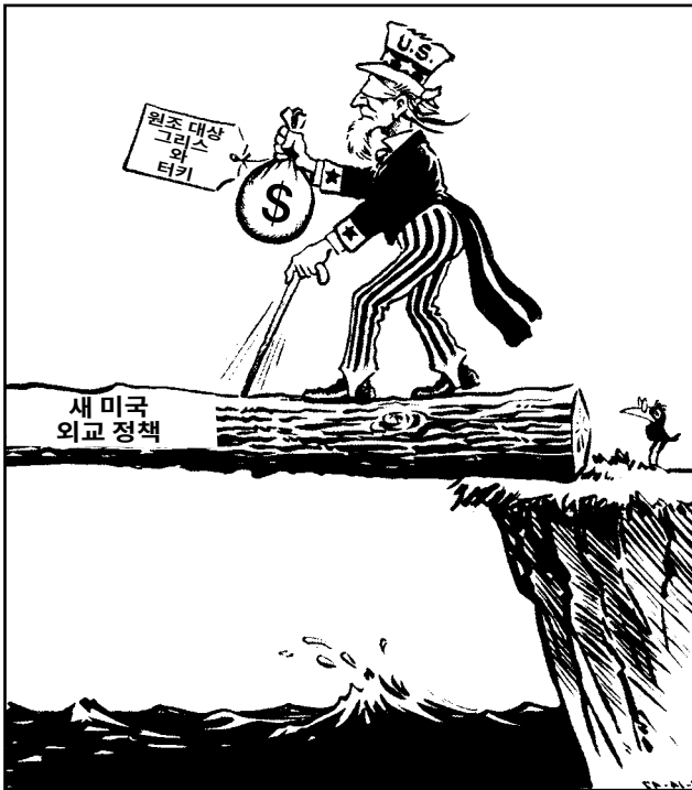
출처: Fred O. Seibel, Richmond Times-Dispatch , March 14, 1947 (개정판)

38 미국의 “새로운” 외교 정책에 대해 이 만화가가 표현한 관점은 무엇입니까?