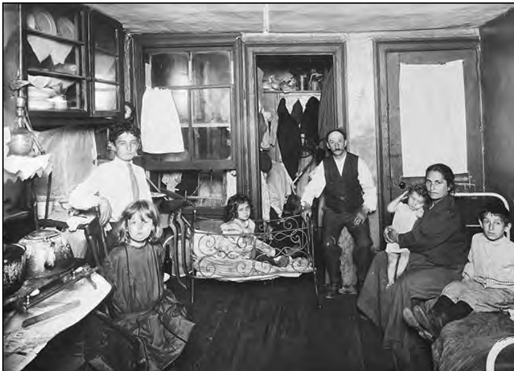
출처: Jacob Riis, How the Other Half Lives: Studies Among the Tenements of New York , Dover Publications, 1971