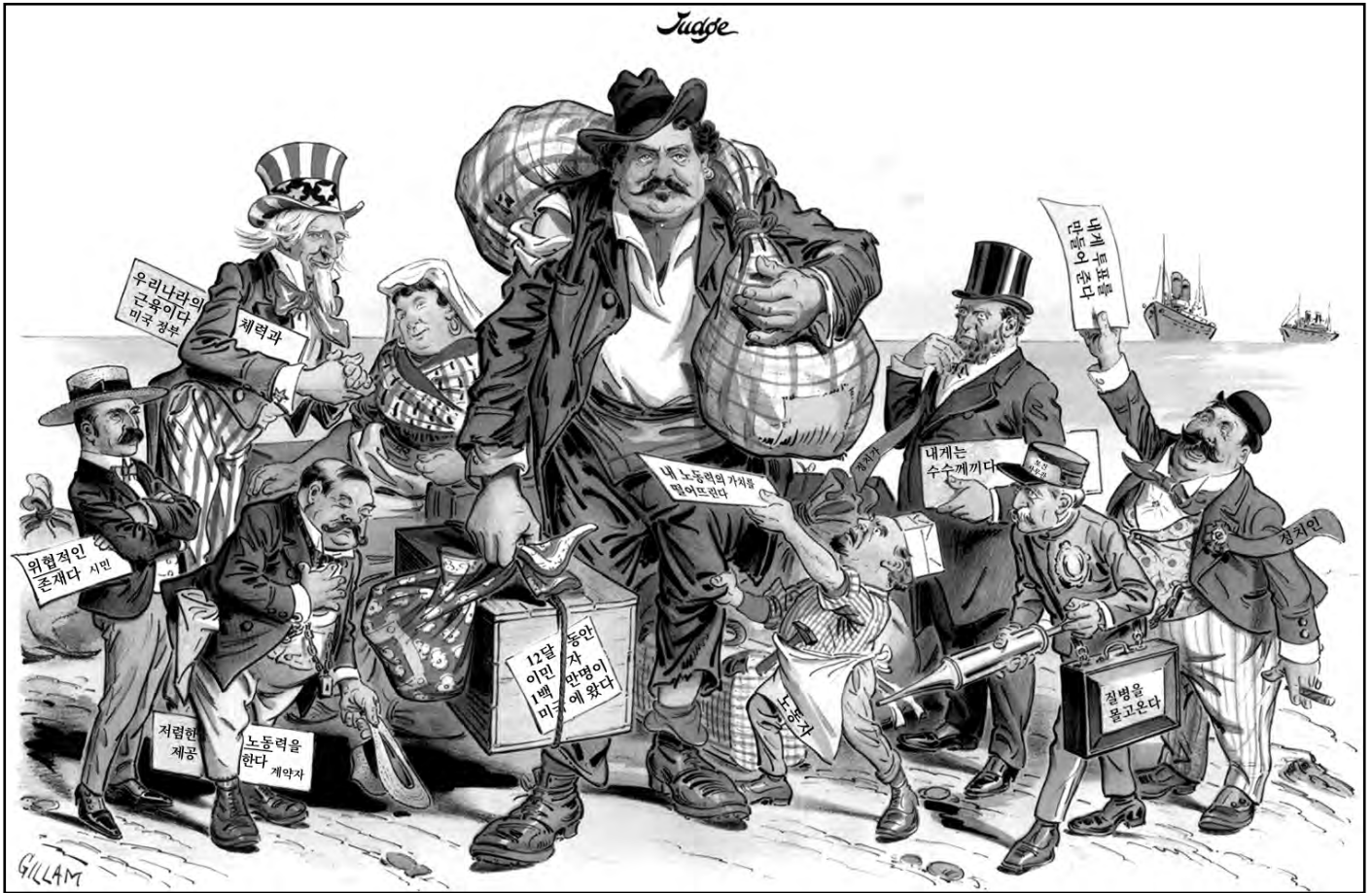
출처: Victor Gillam, Judge , September 19, 1903 (개정판)

25 다음 중 이 1903년 삽화에서 표현된 관점을 가장 정확하게 나타내는 진술은?