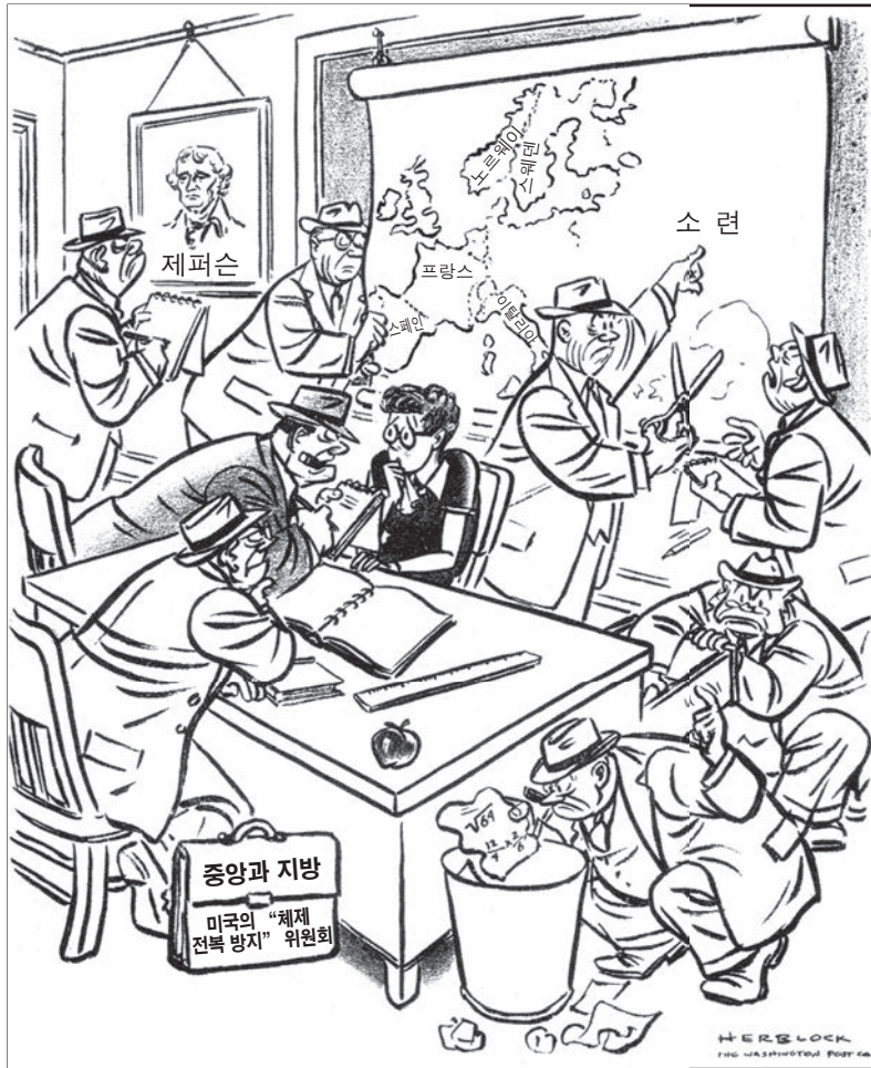
출처: Herblock, Washington Post (개정판)

47 이 삽화가 보여주는 작전들은 다음 중 어느 것과 가장 밀접하게 연관되어 있었습니까?