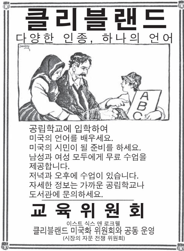
출처 : J. H. Donahey, Smithsonian National Museum of American History, 1917 (개정판)

22번 문제는 아래의 포스터와 자신의 사회과학 지식을 바탕으로 답하십시오.