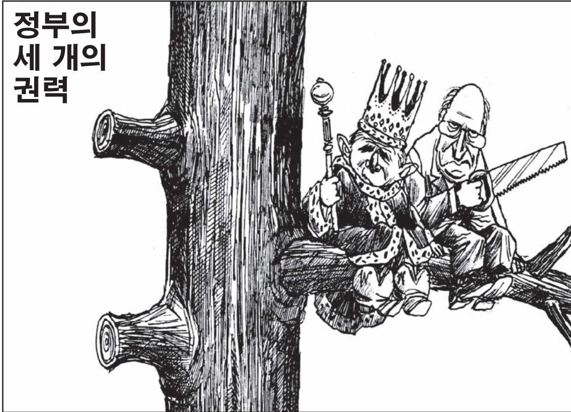
출처: Jim Morin, Miami Herald , July 21, 2006

44번 문제는 아래의 삽화와 자신의 사회과학 지식을 바탕으로 답하십시오.