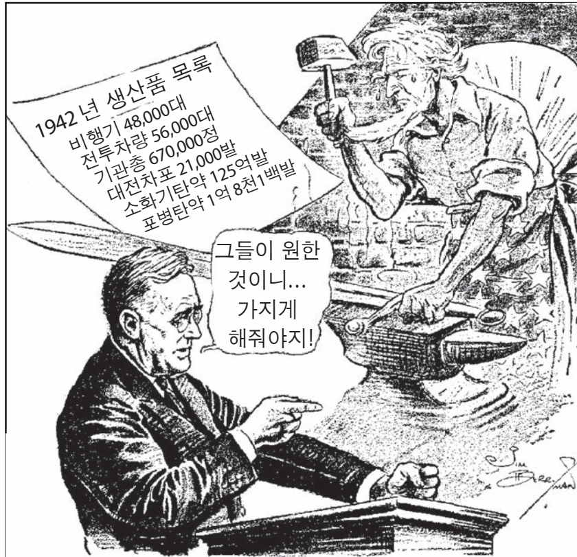
출처: Jim Berryman, Washington Evening Star , January 1943 (개정판)