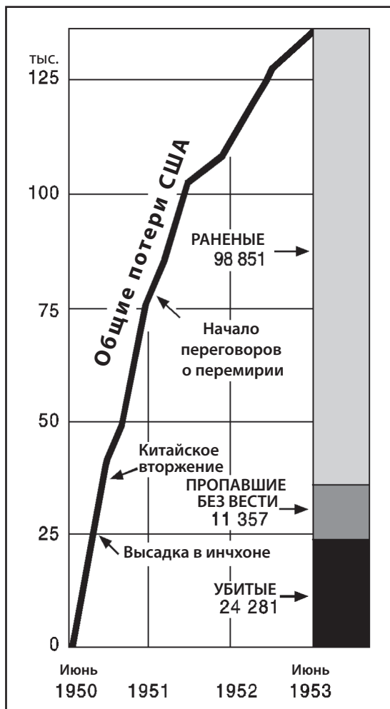
Источник: "Korea: Three Years of War," Time , June 29, 1953 (адаптировано)